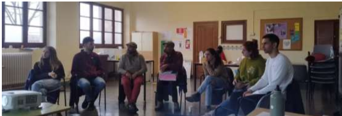
Assistents de l'assemblea.

Es repassen els objectius que té l'assemblea com a encàrrec dels ajuntaments: brindar als joves del Collsacabra un espai on puguin compartir i expressar els seus neguits i preocupacions, tot fent xarxa entre ells, fer propostes d'acció que els permeti buscar i trobar solucions i que la seva veu i les seves propostes arribin a les institucions. La funció de l'equip d'Espai TReS és acompanyar-vos durant aquestes primeres 4 reunions, però amb intenció que posteriorment els membres donin continuïtat a l'assemblea.